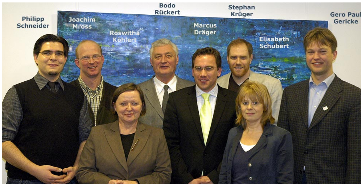
Der Vorstand 2009.