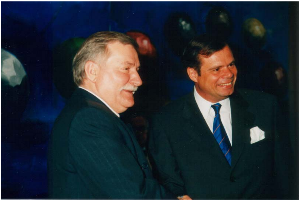
Staatspräsident Lech Wałęsa mit dem Vorsitzenden der DPG Bonn, Dr. Friedbert Pflüger, MdB

Auch in den Jahren 1997 und 1998 deckten die Veranstaltungen zu politischen Themen ein breites Spektrum ab. Es gab zwei hochrangig besetzte Veranstaltungen, die eine mit dem amtierenden polnischen Präsidenten Aleksander Kwaśniewski, die andere mit Lech Wałęsa, der nach seinem Ausscheiden aus dem Amt erstmals wieder nach Bonn kam. Das Aktuelle Kolloquium mit Aleksander Kwaśniewski zur Zukunft der deutsch-polnischen Beziehungen, das gemeinsam mit der Konrad-Adenauer-Stiftung durchgeführt wurde (18.4.1997), hatte eine sehr große öffentliche Resonanz und wurde auch im Fernsehen live übertragen. Einen ähnlich großen Widerhall fand die Veranstaltung mit Lech Wałęsa (18.5.1998).