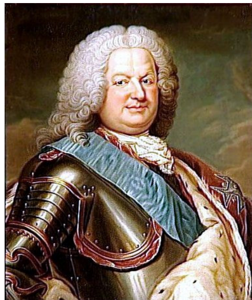
Stanislaus I. Leszczyński