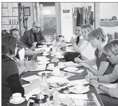
In der AG Gemeinwesenarbeit wurde heiß über Programm und Veranstaltungsort für das große Stadtteilstfest im Oktober diskutiert. Noch bis zum 9. August können Vorschläge gemacht werden.