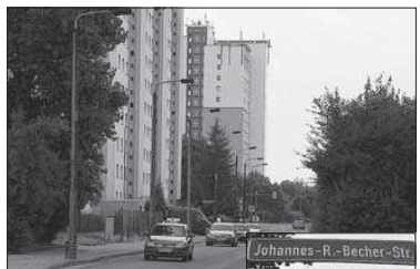
Blick in die Johannes-R.-Becher-Straße, die sich im Stadtteil Kanntenstieg befindet. Fotos (2): R. Richter

(Quellen: Stadtarchiv, Internet: www.wikipedia.org)