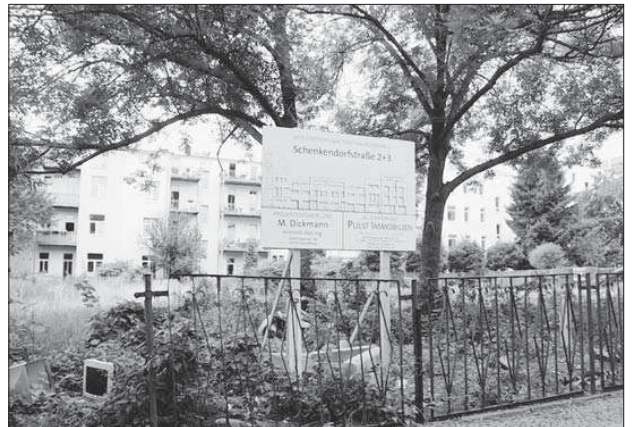
Auf einer derzeit brachliegenden Fläche an der Schenkendorferstraße sollen straßenbegleitend neue Stadthäuser entstehen.

„Es werden fünf bis sieben neue Stadthäuser gebaut“, informiert Ingrid Schenk von der Magdeburger Immobilienfirma „[pma] Immobilienbörse“. Entstehen sollen drei- bis viergeschossige farbige Stadthäuser mit einer geradlinigen Architektur und einem modernen